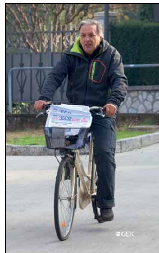
La consegna del settimanale da parte dell'Editore.

Da diversi anni recapitiamo circa 300 giornali con il metodo classico del "fai da te" in