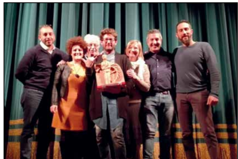
La compagnia Rapoceldone di Carpenedolo vincitrice del 1° premio.

che il premio per la fedeltà al vernacolo ; 2° la Compagnia Ciacere Asolane , di Asola, con la commedia "Gh'era 'na olta en mago"; 3° la Compagnia Botticinese , con la commedia "Patì e mai mörer".