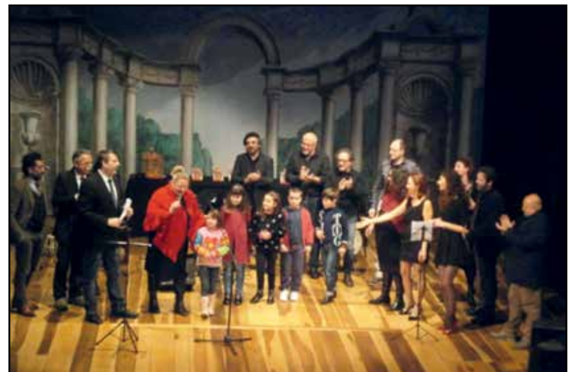
Gli alunni del 2° anno di propedeutica della Banda C. Inico.