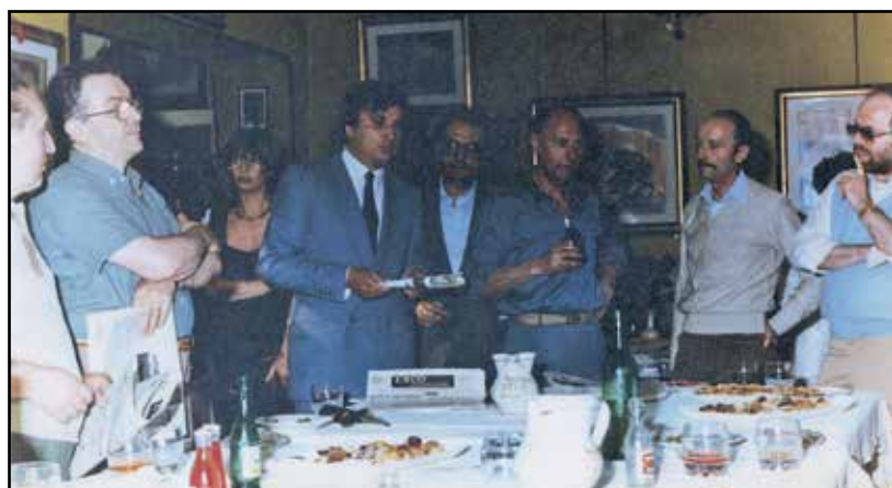
Trattoria "La stella" Piazza Garibaldi presentazione prima edizione dell'Eco della bassa bresciana giugno 1982.

Il nostro senso di impotenza e di vuoto mentale nei colloqui avuti con i responsabili di