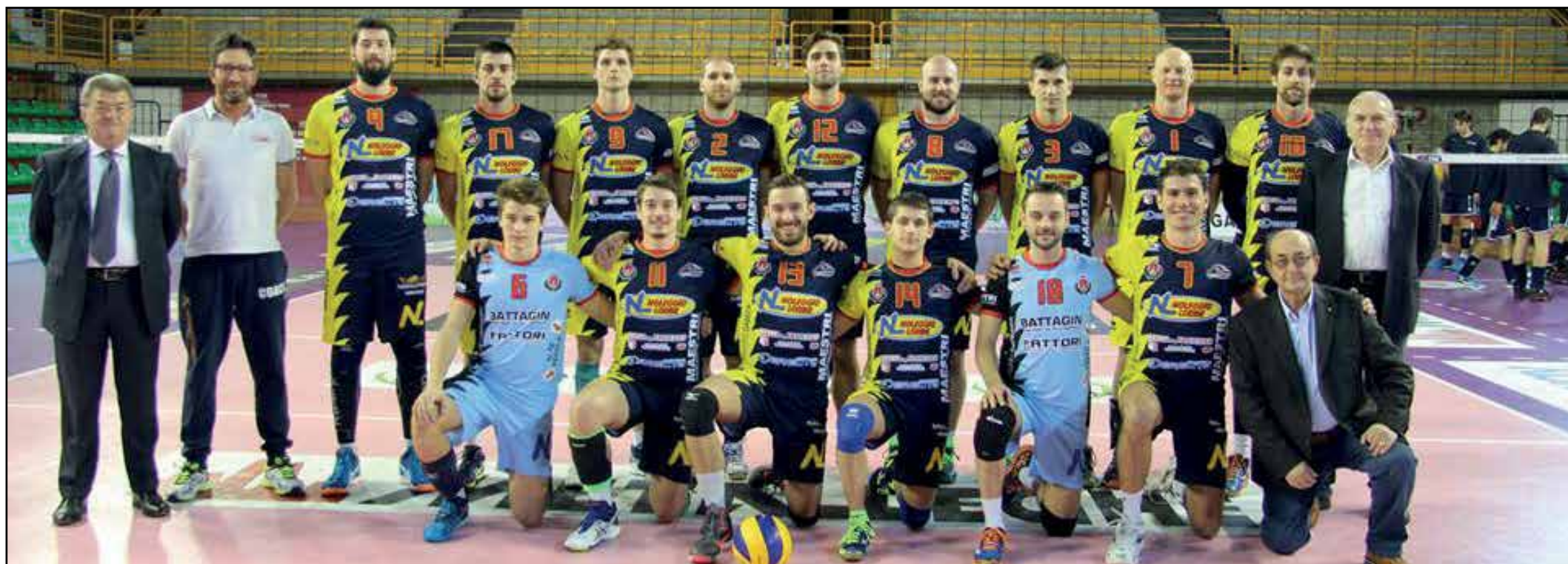
La squadra di pallavolo maschile Lorini prima in classifica campionato di serie B.